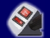
Vypínač a prepínač rýchlostí